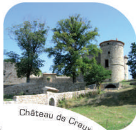
Château de Craux