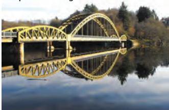
Le pont du Dognon

Les habitants de Saint-Laurent-les-Eglises s'appellent les Eglisieux.