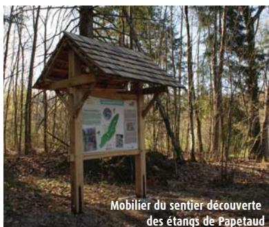
Mobilier du sentier découverte des étangs de Papetaud

Tous nos chemins mènent à vous www.randonnee-hautevienne.com