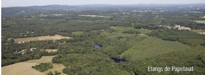
Étangs de Papetaud

4 A la RD142, prendre légèrement à droite dans la rue des Sittelles. Traverser la rue de Payaux et prendre en face l'allée de Payaux. Tourner à gauche dans le hameau, longer les granges et prendre le chemin à droite. Prendre à nouveau à gauche devant des granges puis à droite. Au croisement, tourner à droite et descendre le long de plusieurs étangs. Traverser le pont sur la Cane et remonter jusqu'à la route de Payaux.