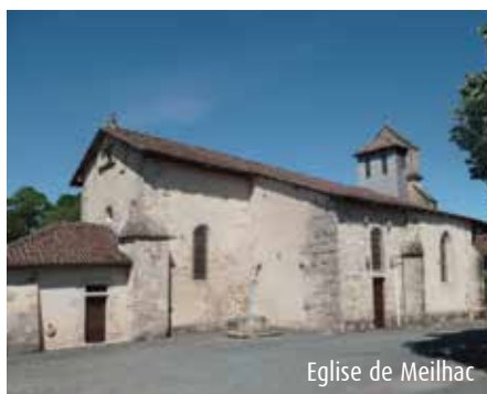
Eglise de Meilhac