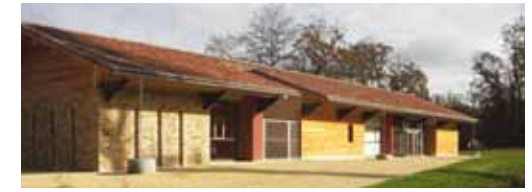
la médiathèque du Père Castor