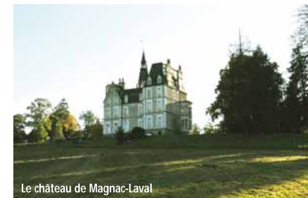
Le château de Magnac-Laval