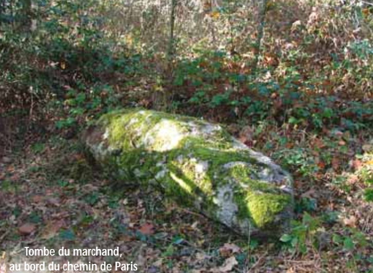
Tombe du marchand, au bord du chemin de Paris