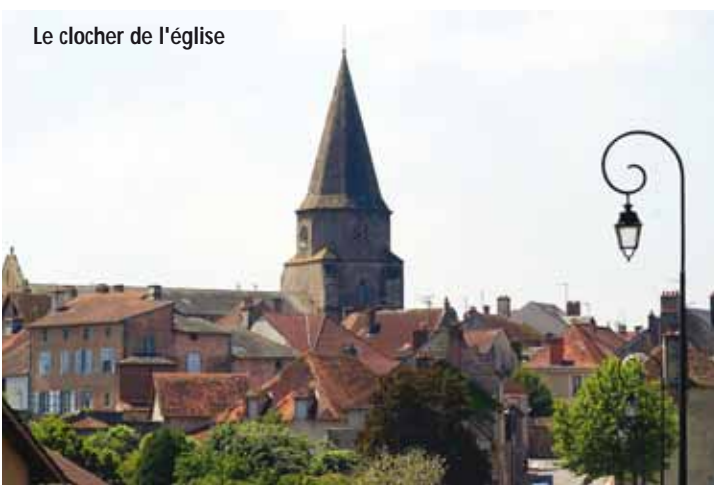
Le clocher de l'église