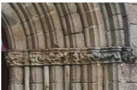
Un détail du portail de l'église

Un circuit de visite avec panneaux explicatifs conduit à la découverte d'une douzaine de maisons cossues s'échelonnant du XV au XVIIIème siècles. Au détour des ruelles et des venelles, observer des maisons à pans de bois et fenêtres à meneaux, des maisons fortes avec leur échaugette ou leurs meurtrières, qui appartenaient au XVIIIème siècle à des notaires, des marchands, un chirurgien, un maréchal-ferrand ou des familles nobles. On peut encore deviner le fossé qui enfermait les maisons à deux étages blotties contre l'église.