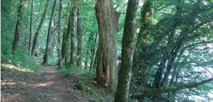
un chemin en bord de lac