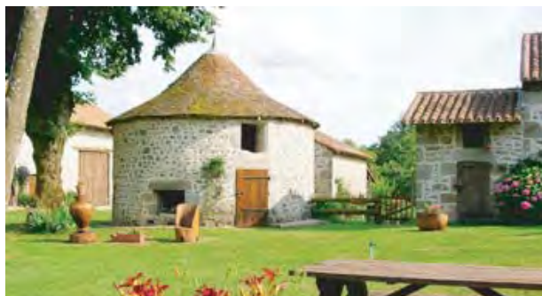
Clédier à Lartimache