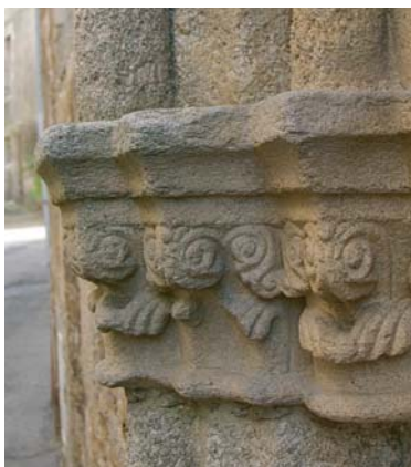
Détail d'un des portails de l'ancien hôpital de Saint-Léonard de Noblat

Au bord de la Vienne, vous pourrez découvrir les moulins, le vieux pont du XIII ème siècle, toutes les petites ruelles qui mènent à la rivière et un peu plus loin, l'église.