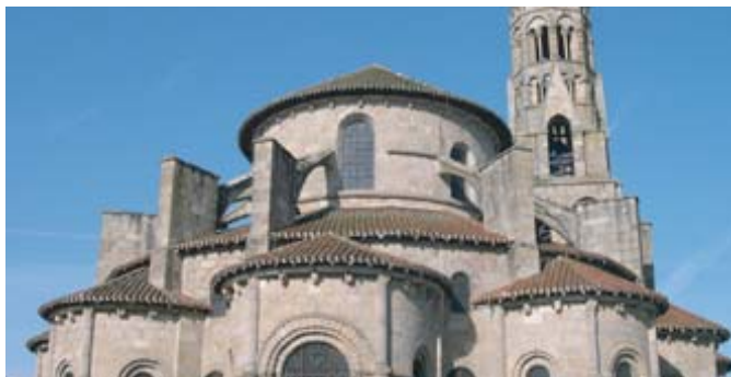
La collégiale romane du XI ème siècle de Saint-Léonard de Noblat

La ville de Saint-Léonard immortalise le nom de son fondateur, ermite vivant dans la forêt de Pauvain au début du VI ème siècle. C'est une ville de pèlerinage qui s'est particulièrement développée à partir du XI ème siècle, lorsque la renommée de Léonard, patron des prisonniers, a atteint tous les pays d'Europe. Elle bénéficie de la popularité du pèlerinage vers Saint-Jacques de Compostelle et devient une étape privilégiée sur la route de Vézelay à l'Espagne. Ainsi, la collégiale romane classée au patrimoine mondial de l'UNESCO au titre des chemins de Saint-Jacques (XI ème - XIII ème siècles) demeure le magnifique témoin de ce succès.