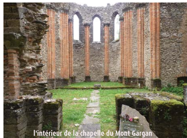
l'intérieur de la chapelle du Mont Gargan

LA CROISILLE-SUR-BRIANCE Le tour du Mont Gargan 4 h 45 - 19 km