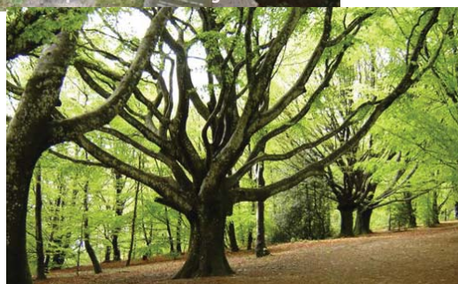
L'allée des hêtres